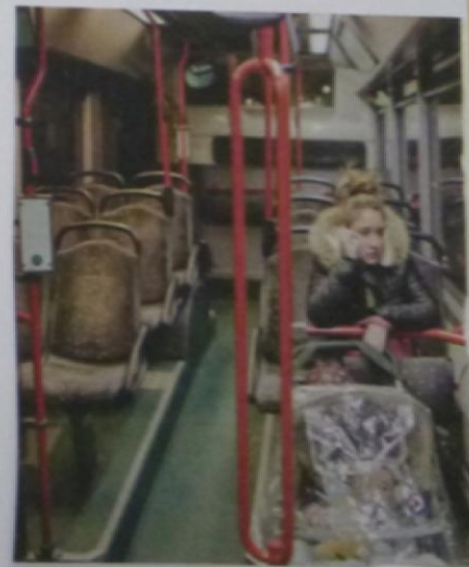
"CE QUI MANQUE, C'EST LA CONSIDÉRATION.