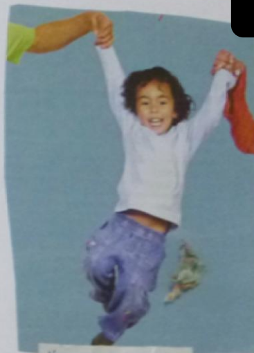
L'accompagner vers une identification positive

"J'ai fait des conneries. Je n'en suis pas fier, mais c'est comme ça qu'on apprend"