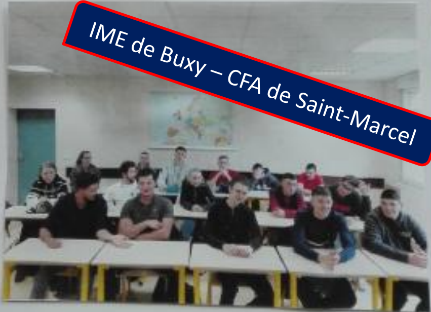
IME de Buxy – CFA de Saint-Marcel

Le handicap ne fait peur à personne ici !!!